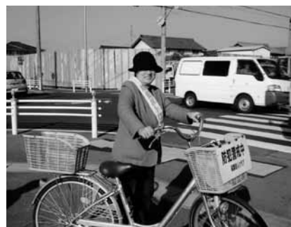
自転車を利用した巡回