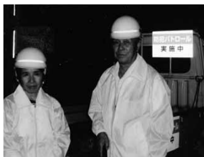
ひったくり多発によるパトロール

また、この他にもたくさんの方々が自主的に活動されています。市内ボランティアの活動を紹介します。