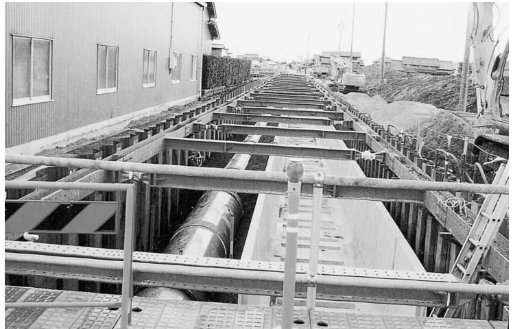
三和町地内の排水路工事