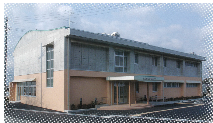
八開地区コミュニティセンター