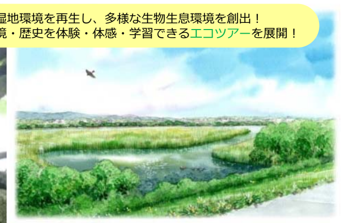
湿地再生のイメージ

湿地環境を再生し、多様な生物生息環境を創出！ 自然環境・歴史を体験・体感・学習できるエコツアーを展開！