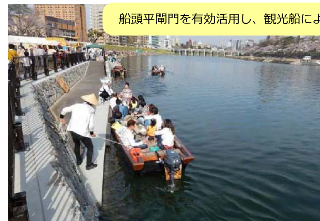
船着き場のイメージ (乙川リパークフロント地区かわまちづくり/岡崎市)