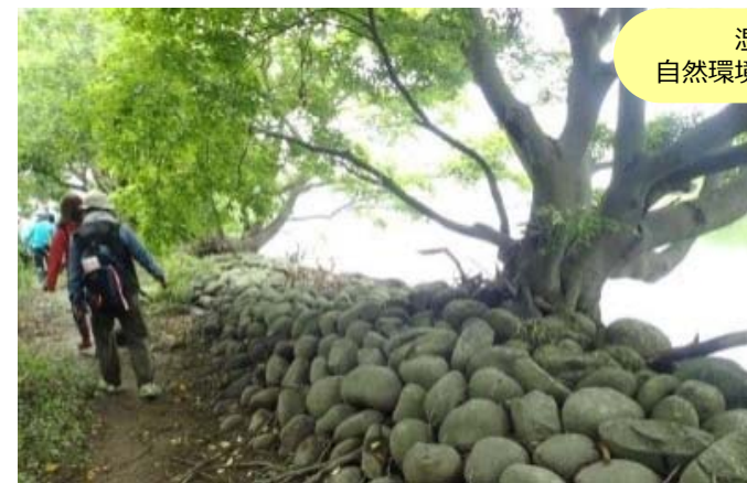
ケレップ水制周辺エコツアアのイメージ