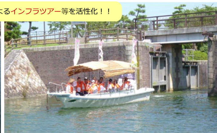
観光船によるインフラツアアのイメージ