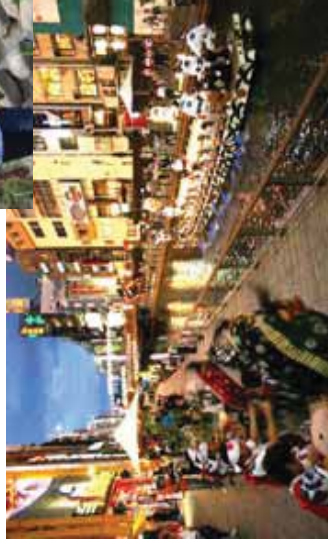
イベント・オープンカフェ利用(道頓堀川)