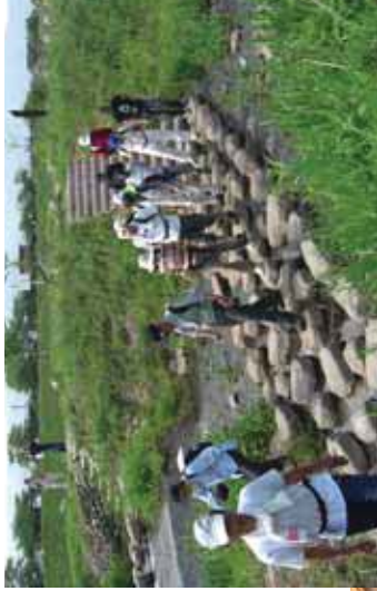
河川を核とした地域活性化(最上川)