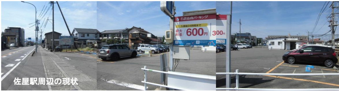
佐屋駅周辺の現状