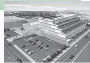
総合庁舎基本設計案イメージ図