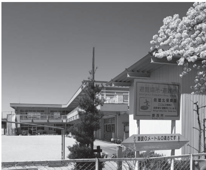
▲存続が望まれる佐屋北保育園