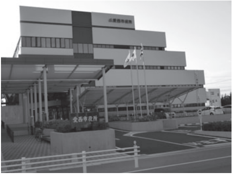
▲合併特例債を活用した統合庁舎

合併特例債による主な事業と起債額、また平成29年度までにいくら合併特例債を起債したか。