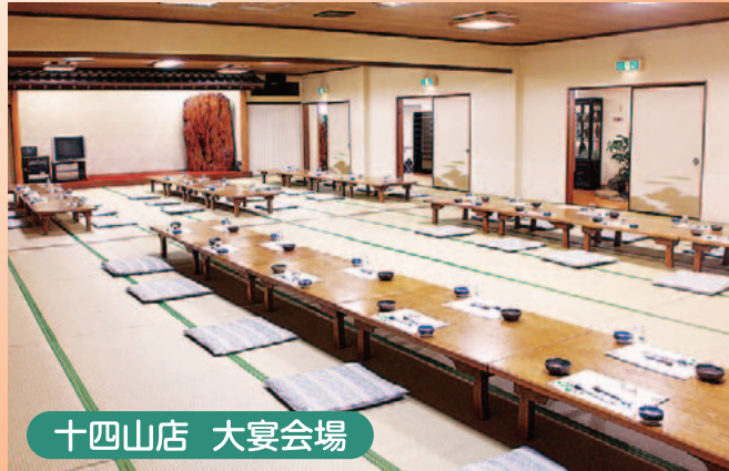
十四山店 大宴会場