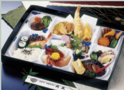
◆初七日割子弁当 3,000円+税

人数に合わせて利用できる大小の個室も便利。お集まりにふさわしい落ち着いた空間で、思い出を語り合いながら和やかに過ごしていただけます。送迎バスも完備していますので、お気軽にご相談ください。