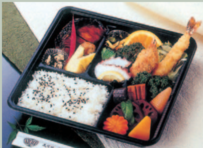
◆葬儀割子弁当 1,000円+税