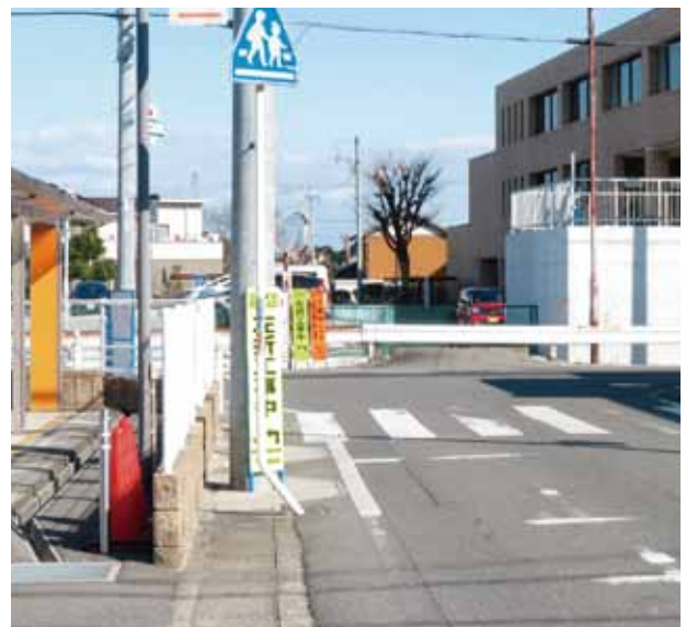
▲撤去された人道橋(根高町)

答 警察とも協議したが、交通安全上、危険なので設置は考えていない。住民への周知の時期については、諏訪と根高の総代と協議していく。