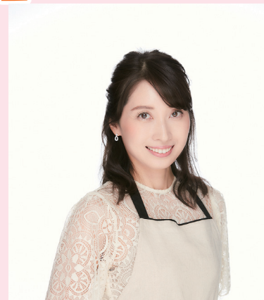
長田絢氏 【プロフィール】

料理研究家、栄養士として、テレビ番組の 料理コーナーやコメンテータとして出演、 企業や行政のレシピ開発、本や雑誌等のフー ドコーディネーターとしても活躍中。Insta gramやYouTube「おさだあやの食卓」で 食の情報を発信している。