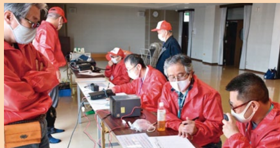
(愛西コミュニティハムクラブ)