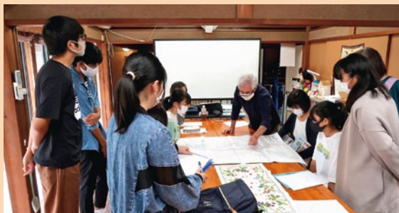
(ハザードマップ作成委員会)