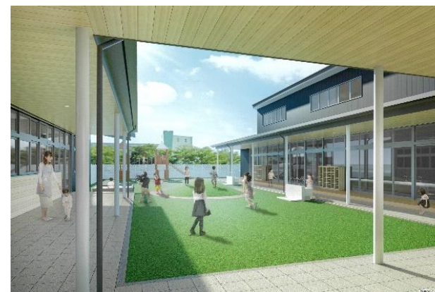
発達支援センター「園庭」イメージ

地域の気軽な相談窓口として、障害者等の自立した日常生活や社会生活に向けた支援を行います。