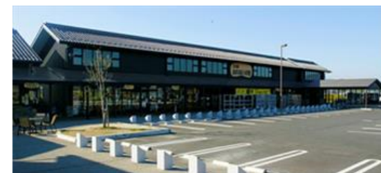
道の駅「立田ふれあいの里」