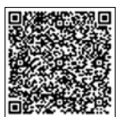
あいち電子申請・届出システム