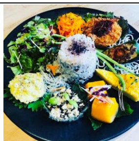
有機野菜のデリプレート