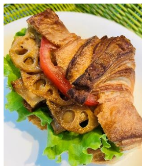
れんこんシャキシャキサンド