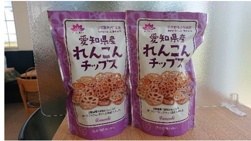
愛知県産れんこんチップス