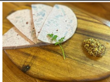
愛西市産レンコン入り自家製 モルタデラ