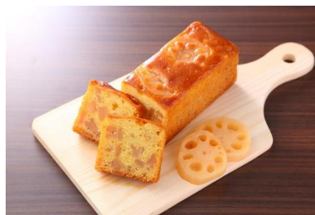
マダム・レンコン