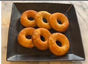
レンコン焼きドーナツ