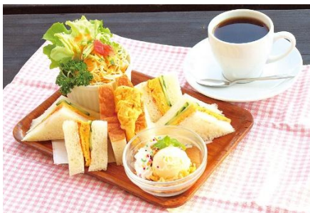
愛西市産の野菜を使用した サンドウィッチセット (ドリンク付き)