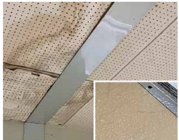
▲雨漏りする学校 (佐屋中学校)

答 改築計画の策定が必要なのは、佐屋小、立田南部小、立田北部小、立田屋中、立田中の5校。改築あるいは改修計画の策定は、永和小、北河田小、勝幡小、永和中の4校だ。