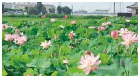
▲都市公園となる花はす田