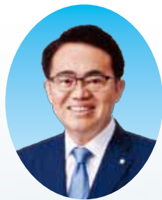
愛知県知事 大村秀章

あけましておめでとございます。 皆様方には、健やかに初春を迎えられたこととお慶び申し上げます。 新型コロナウイルス感染症の世界的な感染拡大が始まって以降、感染症の長期化に加え、資材不足や原材料・原油価格の高騰で幅広い業種の事業者が厳しい経営環境におかれています。 こうした中、県政運営においては、新型コロナウイルス感染症の感染拡大防止はもとより、地域経済の早期回復を最優先課題として取り組んでいます。 とりわけ、県民の安全・安心な暮らしを確保するため、南海トラフ地震を始めとした自然災害や感染症等のリスクに対応し得る危機に強い地域づくりのための施策はもろんのこと、デジタル技術による社会経済の変革(DX)等による次世代産業の育成・振興等の施策に重点的に取り組んでいます。