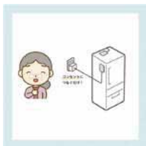
▲センサーの取り付けイメージ

前日の朝7時から当日の 朝7時までには開閉がない と8時頃、当日の夜中の 1時から昼の13時に開閉 がないと14時にセンサー が作動し、電話で安否確