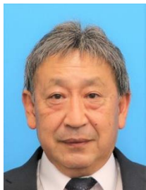
愛西市教育委員会

市内18校の小中学校では、美しい満開の桜が咲き誇る中、入学式・始業式が行われ、令和6年度の新学期がスタートしました。学校では、入学や進級を喜ぶ子どもたちの笑顔や歓声が教室中にあふれていました。