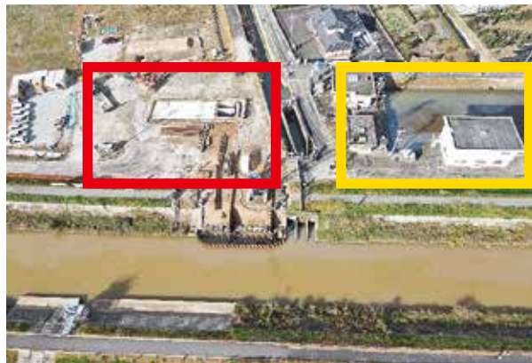
写真 赤枠 は建設中の八開排水機場、 黄枠 が既設排水機場

しかし、この更新工事が終わっても、安心はできません。次の古い排水機場の更新を行わなければならないからです。災害を起こさないように施設を維持していくには、こういった更新工事を繰り返していくことになるため、多大な費用と時間が必要となります。工事中は何かとご不便をおかけしますが、ご理解、ご協力をお願いします。