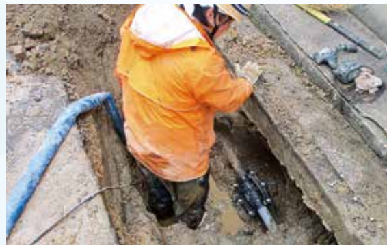
劣化した水道管と漏水修繕の様子