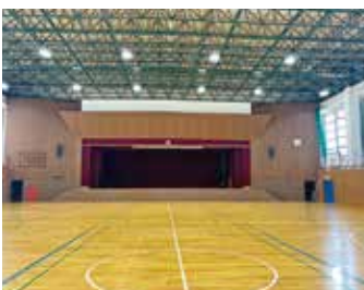
▲佐屋中学校体育館

Q スポットエアコンと換気設備の併用は、 A 室内機、室外機を別々に設置する。屋内で