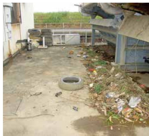
排水機場で回収されたゴミ

水路に捨てられたゴミなどは、排水ポンプの運転を妨げ、故障の原因になり、災害時に地域を水害から守ることができなくなってしまいます。空き缶、ビニール、粗大ゴミなどを捨てないようにしましょう。